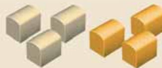
18 baúles (en caso de 3 personas)