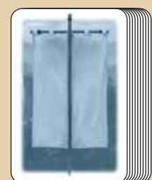
10 cartas de acción