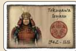
1 carta daimyo y 5 cartas de baúles

Los ejércitos y los baúles de los jugadores se dejan siempre a la vista de todos. El material de juego que no sea necesario (porque participan menos de 5 jugadores) se devuelve a la caja.