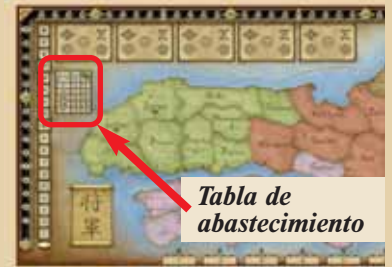
Tabla de abastecimiento

Entonces siguen otras 4 rondas (primavera, verano, otoño e invierno), que concluyen en invierno con el segundo y último recuento de puntos.