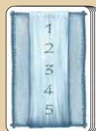
5 cartas especiales

Ejemplo: 4 cartas de eventos -sacadas al azar- se colocan boca arriba