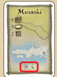
... Vale para los dos lados del tablero.

En caso de una partida de 3 personas , se eliminan en el lado del tablero (sol/luna) las siguientes provincias: