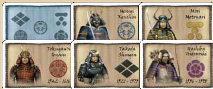
Lados trasero y delantero de las cartas de daimyo