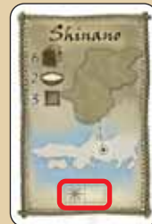
... Vale para el lado del tablero "Sol".