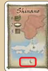
... Vale para el lado del tablero "Luna".